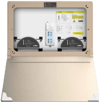
Рис.1. Внешний вид