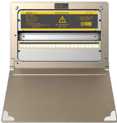
Рис.1. Внешний вид