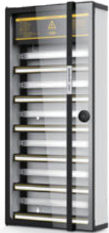
Рис.1. Внешний вид