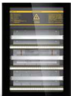
Рис.1. Внешний вид