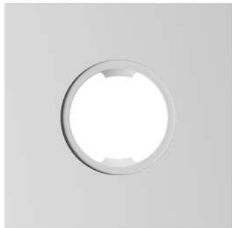
Рис.1. Внешний вид