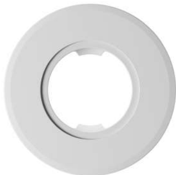
Рис.1. Внешний вид